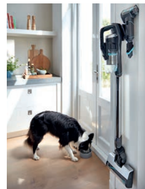
Tyčový vysavač vždy po ruce

Nejvyšší sací výkon přitom znamená u akumulátorových modelů výdrž v pouhých jednotkách minut. Zdá se vám to málo? Uvědomte si ale, že nejintenzivnější sání potřebujete pouze na koberci. Na pevných podlahách nikoliv, i když většina z nás u starých vysavačů automaticky nastavovala nejvyšší výkon. Vysavač po celou dobu běžel naplno a spotřebovával úplně zbytečně spoustu elektřiny. Tyčový aku vysavač byste měli používat chytře - na pevných podlahách na nižší nebo střední sání, pouze na kobercích s nastavením nejvyššího výkonu. Účinnost sběru výrazně zvyšuje motorizovaný kartáč, jímž jsou vybaveny v podstatě všechny modely na trhu. Jen výjimečně se vám tedy stane, že byste baterii vybili a museli úklid přerušit.